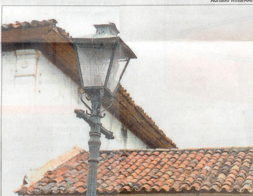
Telhas feitas por escravos serão trocadas por novas, no mesmo estilo