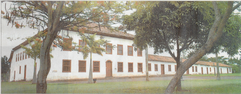
A casa-sede da fazenda, que abriga hoje um museu histórico e pedagógico, receberá investimentos de R$ 5 milhões: quarto da "sinhozinha" é uma das curiosidades

Com o casarão recuperado, a Prefeitura pretende incrementar o turismo. Hoje, ele tem um acervo diversificado — fotografias, mapas, objetos, máquinas e mobiliário — que busca contar um pouco da história da cidade, do seu povo e dos períodos históricos que Americana testemunhou. "Vamos poder acrescentar mais coisas a esse acervo e o principal, abrir o local para visitação pública e incrementar o turismo, podendo até fazer uma espécie de turismo rural, já que próximo dali temos a comunidade do Sobrado Velho", disse o secretário. O casarão é tombado desde 1982 pelo Conselho de Defesa do Patrimônio Histórico, Arqueológico, Artístico e Turístico do Estado de São Paulo (Condephaat).